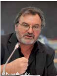
© Pascale Lalys Dominique Launay Secrétaire de l'UIT