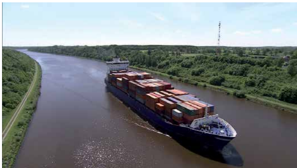
Canal de la Moselle

À travers le projet routier de l'A31bis, soumis au débat public auquel ont participé les organisations de la CGT du Comité Régional (professions du champ transport et territoire), ce sont des sommes importantes qui devront être dépensées afin d'augmenter la capacité du mode routier sur le sillon lorrain.. Pourtant, ce mode de transport provoque bien des nuisances : pollution de l'air, pollution sonore et congestion notamment. Avec une moyenne de 8 à 12 000 PL par jour et un trafic davantage orienté vers le transit (55% en moyenne, plus de 70% sur certaines sections vers la frontière du Luxembourg) ils représentent pour beaucoup les plus grands contributeurs à ces nuisances.